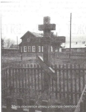
Здесь покоятся отец и сестра святого

Но теперь сломался, никак починить не могут.